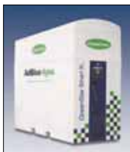
GreenStar Smart XL