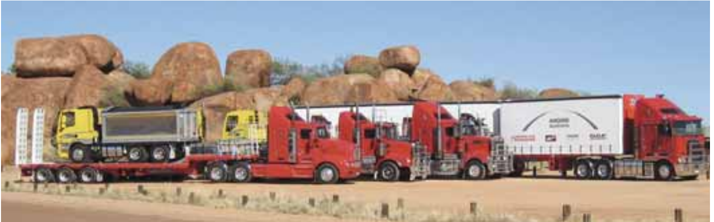
Les camions Kenworth et DAF sur la route du Queensland.