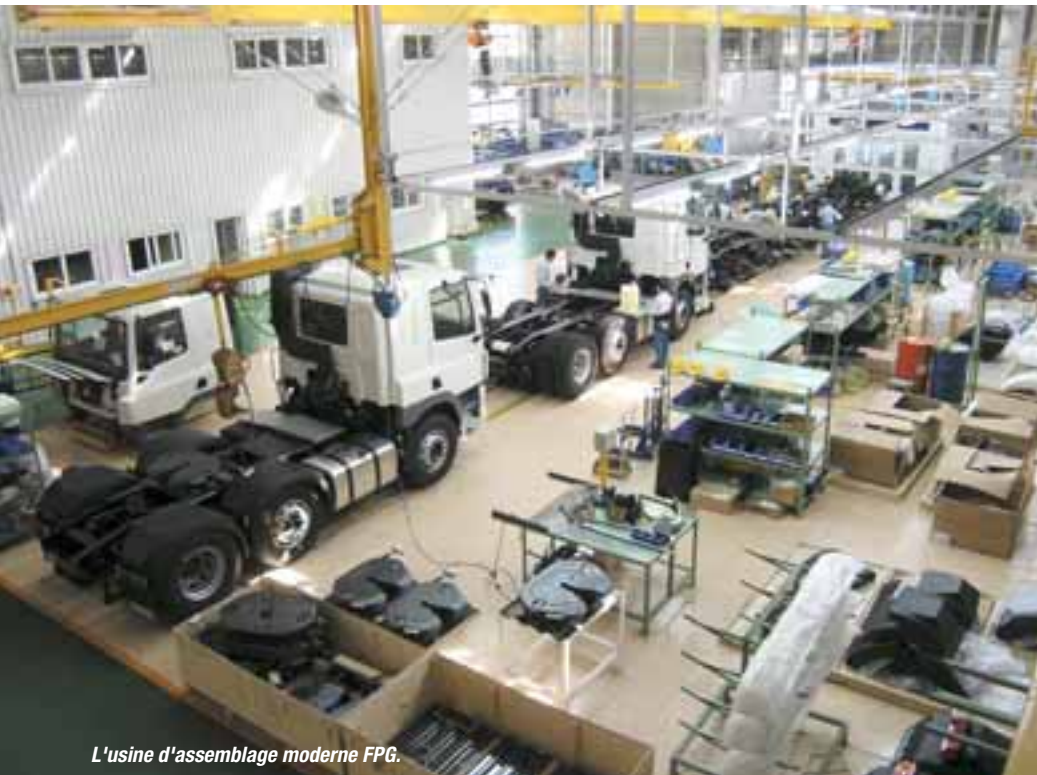
L'usine d'assemblage moderne FPG.